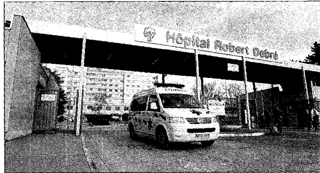
L'Etat va mettre 13,5 millions d'euros de plus sur la table entre 2009 et 2012 dans le cadre du déficit structurel de l'hôpital.

Le conseil d'administration du CHU a voté hier le plan de retour à l'équilibre avec 11 voix pour et 7 contre, dont celle de la maire.